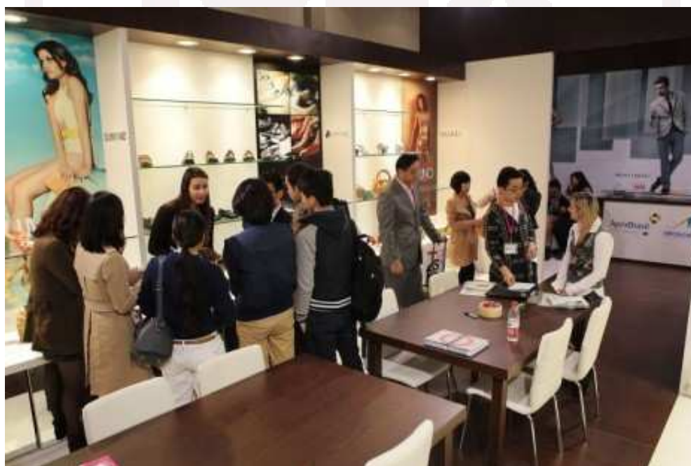
Pabellón oficial Brasil, "Brazilian Footwear" (interior)