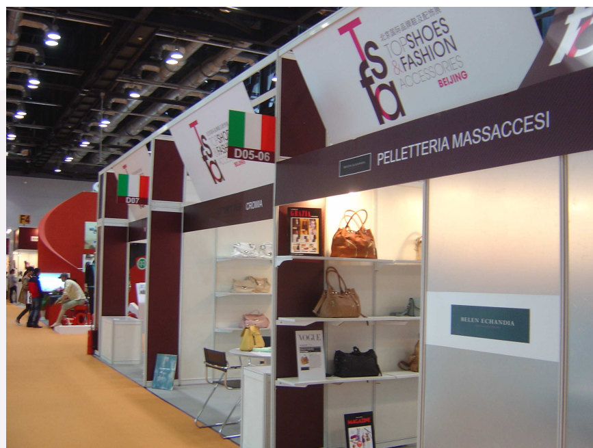
Zona de expositores italianos