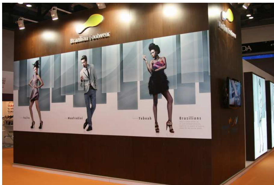
Pabellón oficial Brasil, "Brazilian Footwear" (exterior)